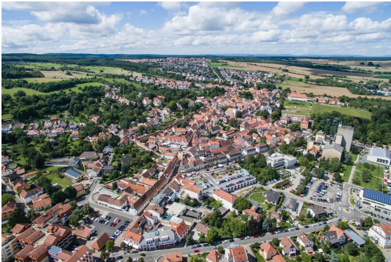
Die Stadt Kirchheimbolanden aus der Luft gesehen (2020)