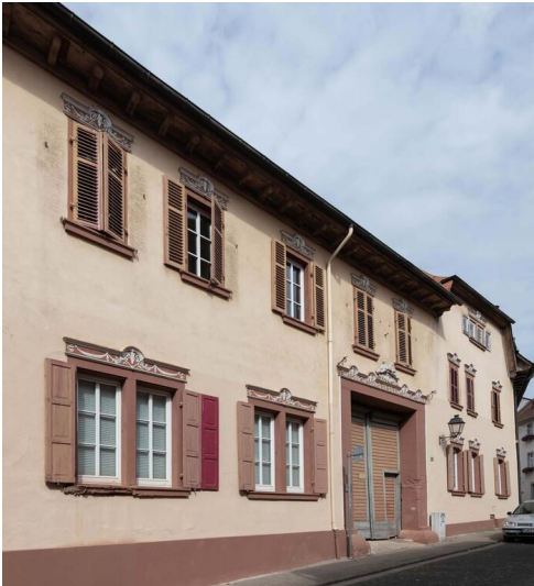
Der im barocken Stil erbaute vordere Teil des Münzhofes in Kirchheimbolanden von der Langstraße aus gesehen (2020)