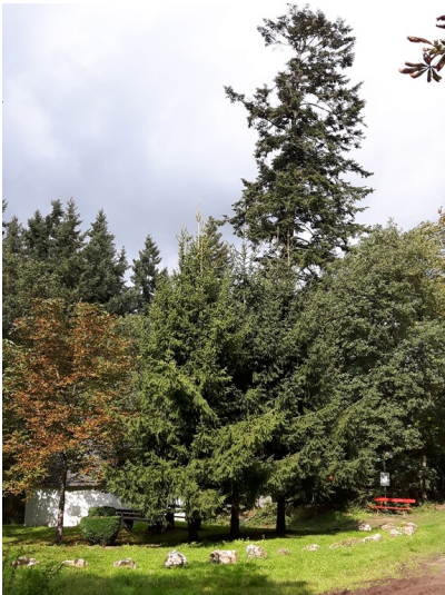
Hörnerbaum Weißtanne (2017)

Schlagwörter: Baum Fachsicht(en): Landeskunde Gemeinde(n): Briedel Kreis(e): Cochem-Zell Bundesland: Rheinland-Pfalz