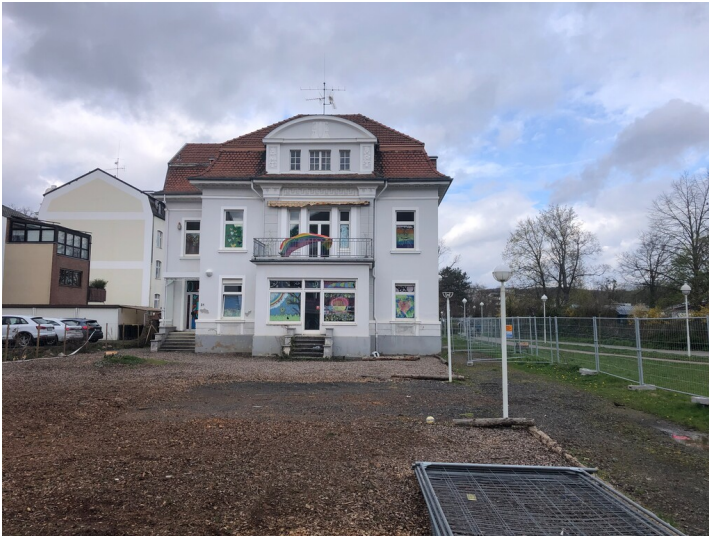
Villa Schmitz, Mittelstraße 31 in Bad Neuenahr (2024)