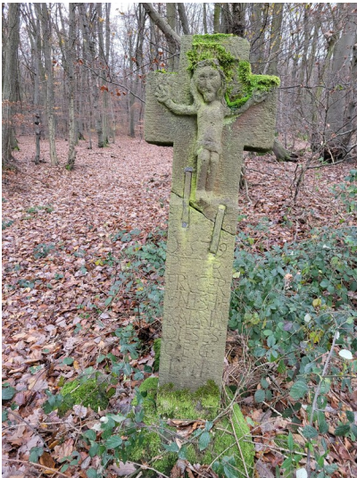
Wegekreuz im Vinxtbachtal (2023)