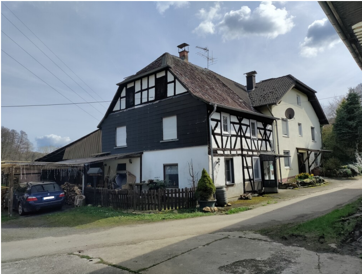
Blick auf den Gebäudekomplex der Quirrenbacher Mühle (2024)