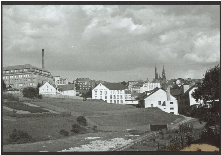
Historische Fotografie der Gerberei Gebrüder Fahr im Strecktal in Pirmasens (um 1950)