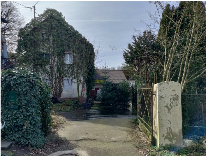
Blick nach S: Einfahrt in den Zweiseitenhof Hanfmühle (2024)