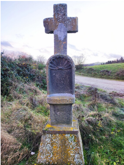
Hockerts Kreuz am Ahrsteig bei Hönningen (2024)