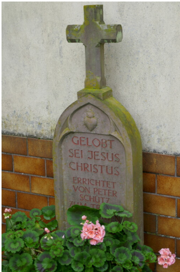
Sandsteinkreuz am Haus in der Hauptstraße 6 in Wawern (2023)