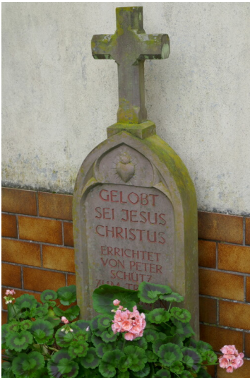
Sandsteinkreuz am Haus in der Hauptstraße 6 in Wawern (2023)