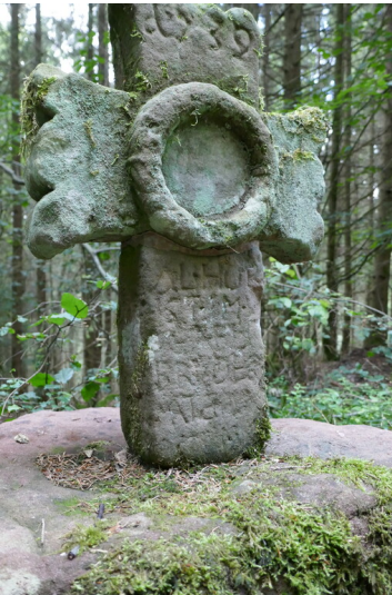
Sandsteinkreuz an der Dürrbach bei Wawern (2023)