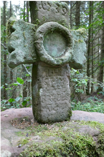
Sandsteinkreuz an der Dürrbach bei Wawern (2023)