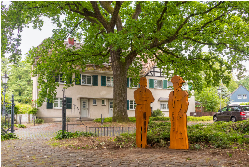
Die beiden Zwischerkisten in Gestalt von Anna und Richard Zanders stehen auf dem Eichplatz und geben Details zur Gründung der Gronauer Waldsiedlung preis (2022).