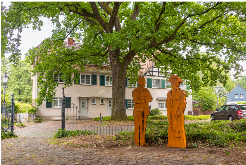
Die beiden Zwischerkisten in Gestalt von Anna und Richard Zanders stehen auf dem Eichplatz und geben Details zur Gründung der Gronauer Waldsiedlung preis (2022).