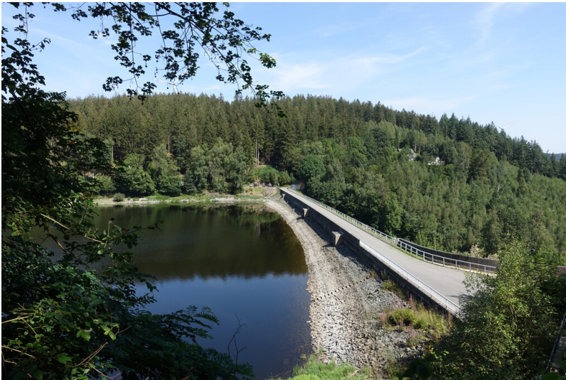
Staumauer der Kalltalsperre (2024)