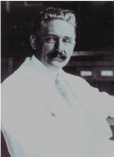
Porträt von Dr. Georg Franz Straub