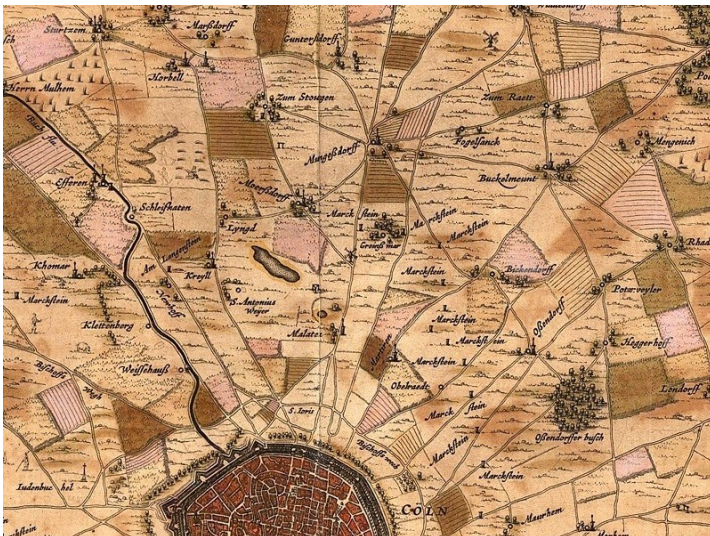
Ausschnitt eines Kupferstichs von Joan Blaeu (1596-1673), die auf 1663 datierte Karte "Descriptio Agri Civitatis Coloniensis" zeigt die Umgebung von Köln.