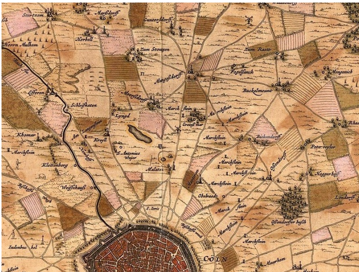
Ausschnitt eines Kupferstichs von Joan Blaeu (1596-1673), die auf 1663 datierte Karte "Descriptio Agri Civitatis Coloniensis" zeigt die Umgebung von Köln.