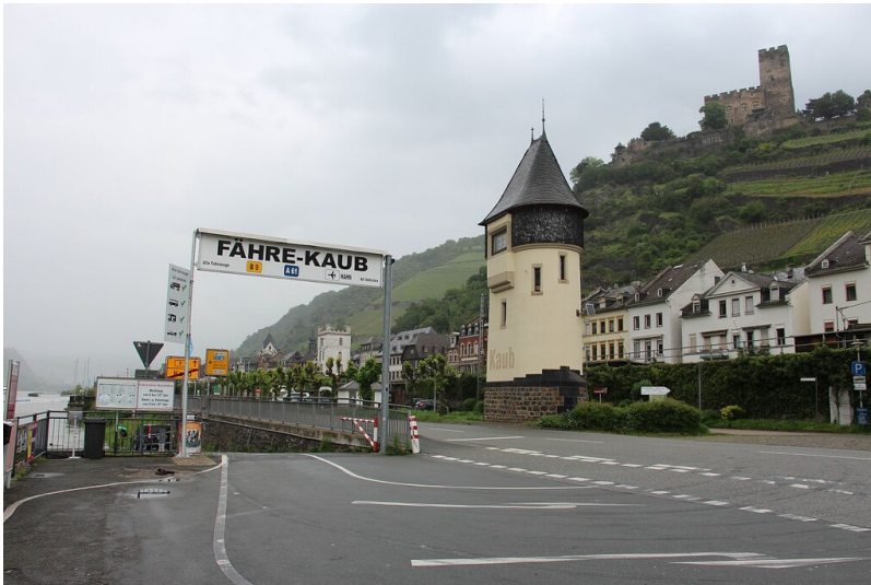
Der Pegelturm nahe der Fähre und unterhalb der Burgruine Gutenfels in Kaub (2023)

Schlagwörter: Pegelhaus Fachsicht(en): Landeskunde Gemeinde(n): Kaub Kreis(e): Rhein-Lahn-Kreis Bundesland: Rheinland-Pfalz