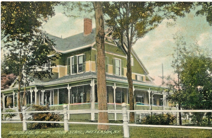
Privathaus von Jacob Stahl (um 1905)