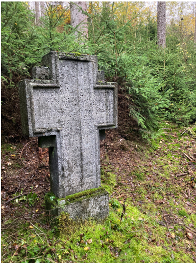
Gedenkkreuz für Johann Söns nahe Hollerath