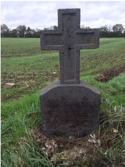
Unglückskreuz von Jakob Pauli (2023)