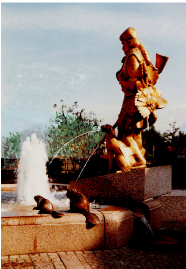
Lederstrumpf-Brunnen in Edenkoben (2019)