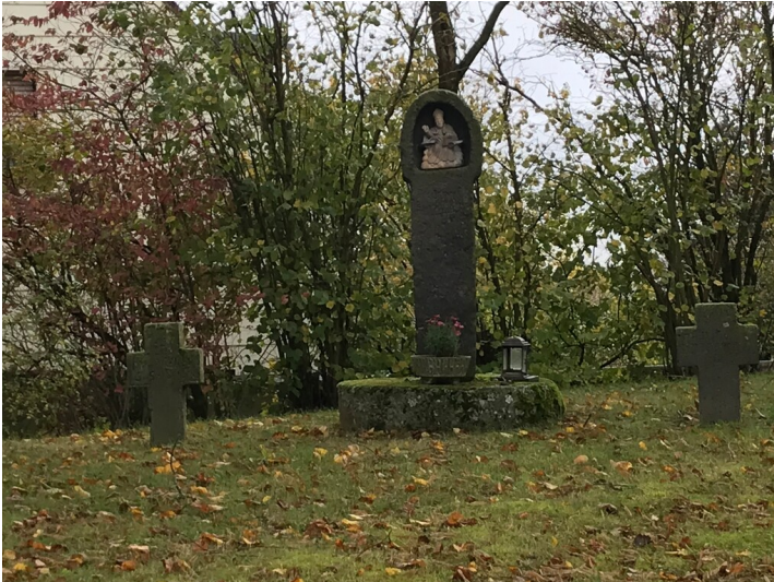
Schöpflöffel in Kehrig (2023)