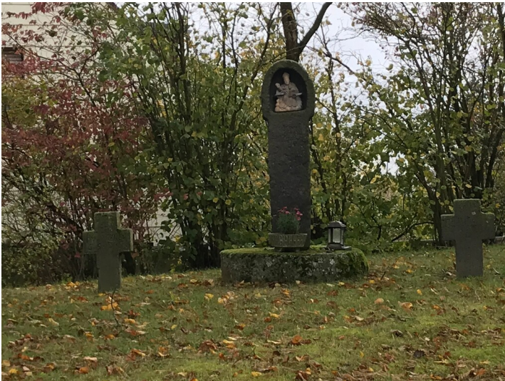
Schöpflöffel in Kehrig (2023)