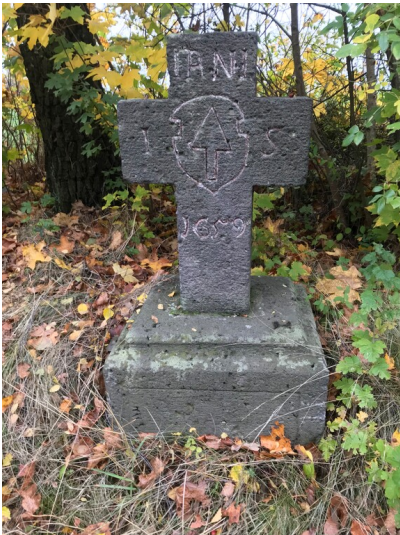
Wegkreuz 1659 in Kehrig