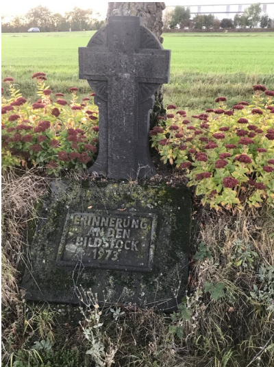
Gedenkkreuz "Erinnerung an den Bildstock 1973" (2024)