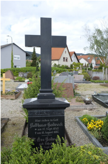
Grabstätte Heilweck Maikammer (2021)