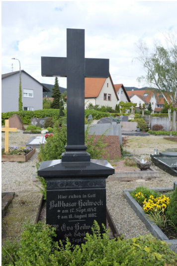
Grabstätte Heilweck Maikammer (2021)