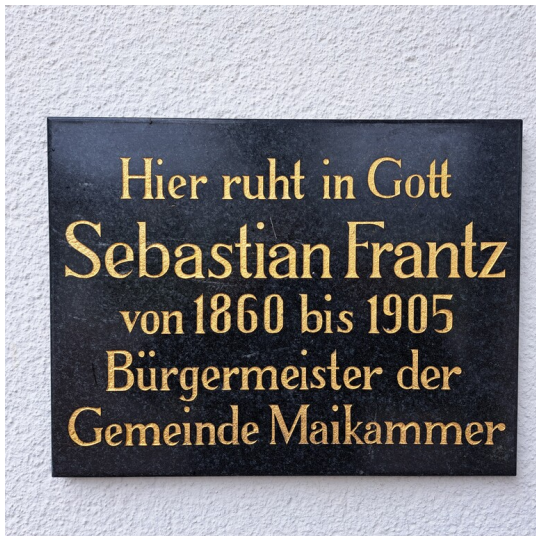
Platte für Sebastian Frantz (2024)