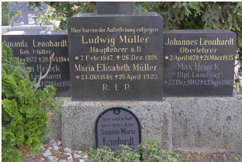
Grabstätte Leonhardt Maikammer (2021)