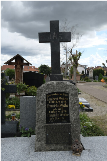
Grabstätte Wothe Maikammer (2021)