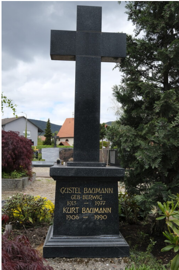
Grabstätte Baumann Maikammer (2021)