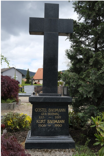
Grabstätte Baumann Maikammer (2021)