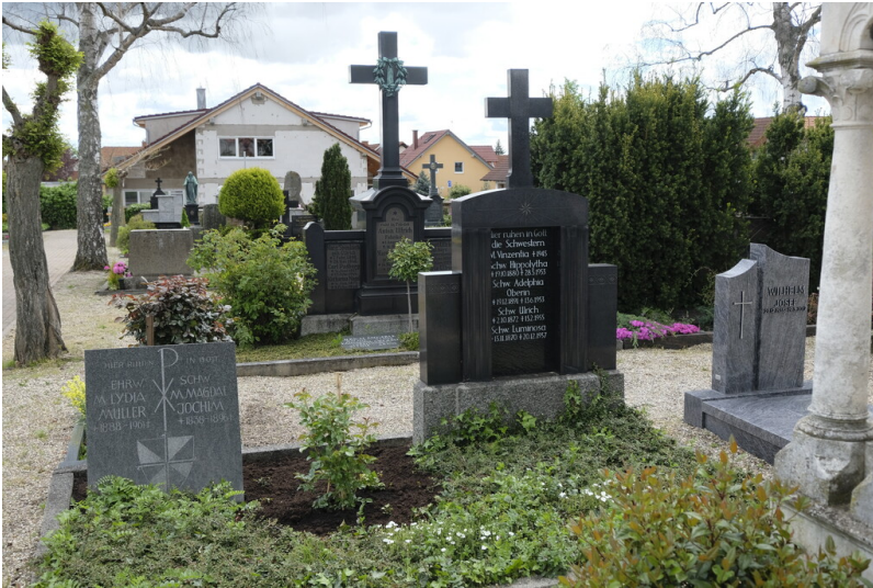
Schwesterngrabstätte Maikammer (2021)