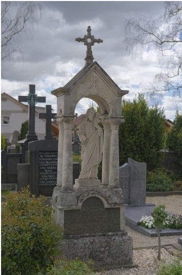
Priestergrabstätte Maikammer (2021)