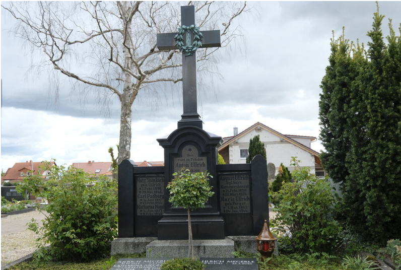
Grabstätte Ullrich (2021)