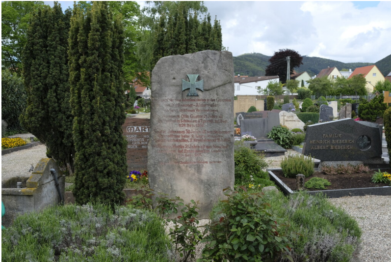
Grabstätte I. Weltkrieg (2021)