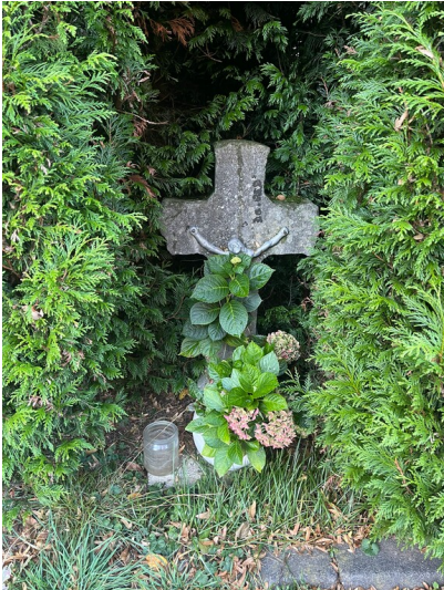
Wegekreuz an der Schergasse in Sistig (2023)