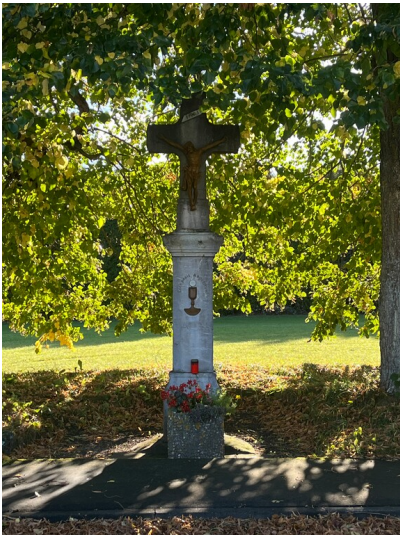
Wegekreuz an der Schleidener Straße in Sistig (2023)