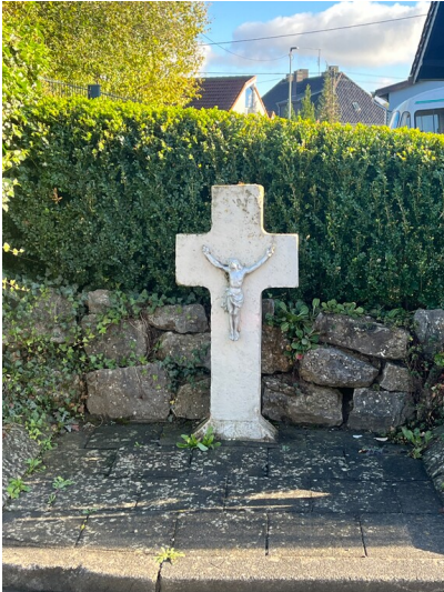
Wegekreuz am Frohrrather Weg in Sistig (2023)