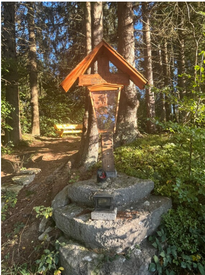
Wegekreuz an der Blankenheimer Straße in Sistig (2023)