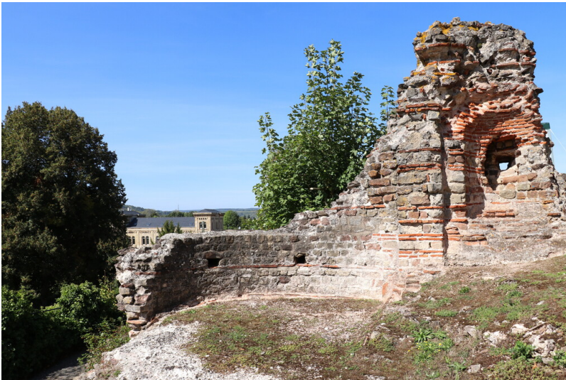
Römischer Kaiserpalast Konz (2018)