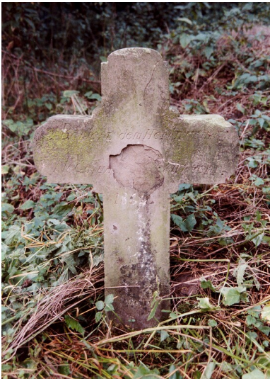
Ältere Aufnahme vom Kreuz an der Koblenzer Straße bei Blankenheim (vermutlich Mitte der 2000er).