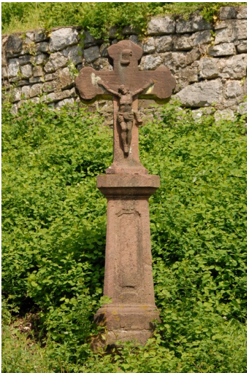
Das Kreuz am Hohnegässchen bei Blankenheim (2009)