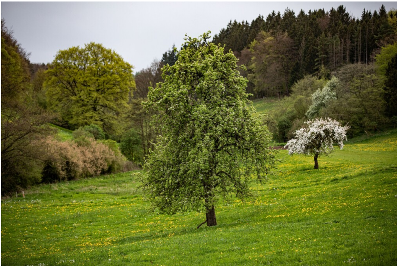
Alter Birnbaum im Karschsiefen bei Nettersheim-Pesch (2023)