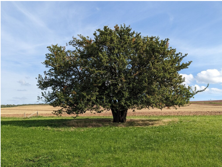
Vielstämmiger Birnbaum in Weiler am Berge (2023)