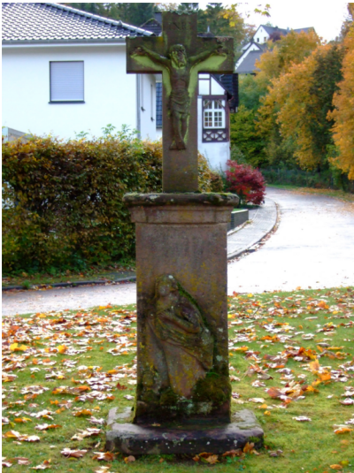
Votivkreuz an der Alten Trierer Straße (2023)