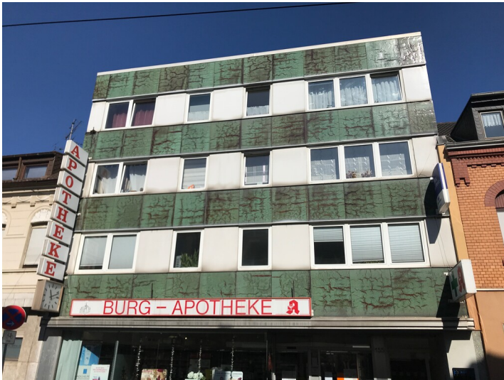
Die Fassade des Wohn- und Geschäftshauses wird gegliedert durch Fensterreihen und Reihen aus grün-braunen KerAion-Platten (2020)