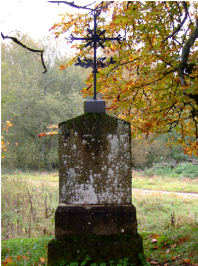
Altes Grabkreuz von Anna Biehl (2023)