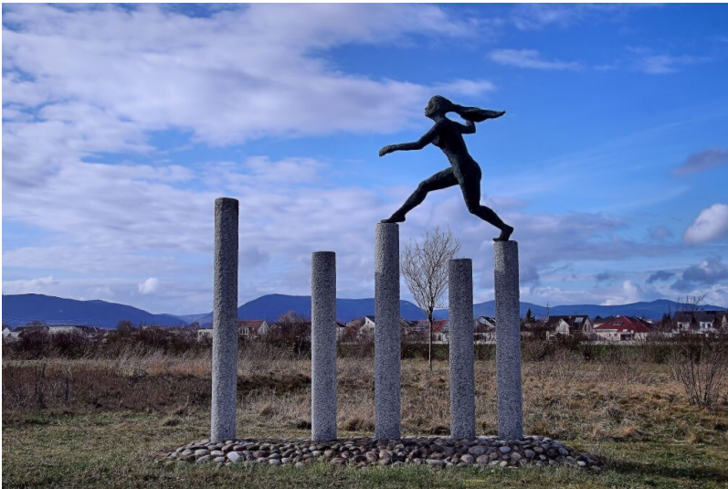
Skulptur Dynamik mit Sprinterin Gemeinde Bornheim (2017) Fotograf/Urheber: Gemeinde Bornheim